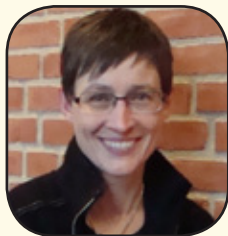
af Marianne Dykær

Grundtvig skriver mange af sine salmer, med den danske natur som afsæt, som det der sætter grundtonen, og hertil føjer han kristendommen, som en rød tråd, der væves ind i naturens billeder.