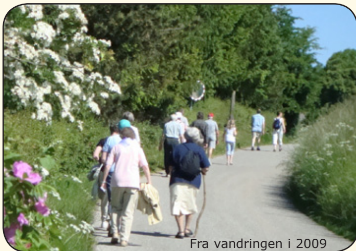
Fra vandringen i 2009