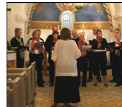
Kirkekor medvirker ved julekoncerten

Tilhørerne vil få rørt deres sang- stemmer. Der vil også komme et orgelstykke eller to undervejs.